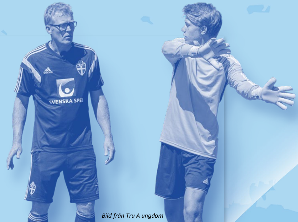
Bild från Tru A ungdom